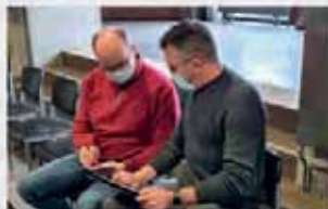
15. JANUAR 2022