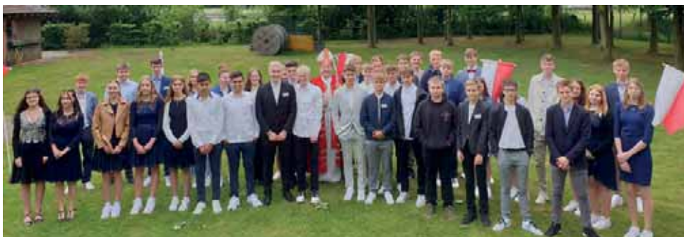
Gefirmte aus Velen mit Weihbischof Hegge

Dies soll auch im nächsten Jahr der Fall sein; die Firmfeiern sind dann am Pfingstsamstag, 27. Mai, morgens um 10 Uhr und um 11.15 Uhr. Dazu werden im Dezember die katholischen Jugendlichen eingeladen, die zwischen 1.10.2007 und 30.09.2008 15 Jahre alt werden. Auch Jugendliche anderer Jahrgänge können an der Firmvorbereitung teilnehmen. Diese müssen sich aber selbständig melden. ( schulzeherding-j@bistum-muenster.de oder menke-w@bistum-muenster.de )