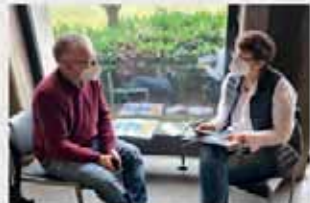
PFARREIRAT ST. PETER UND PAUL